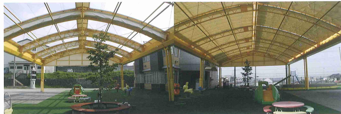
KRG500 シリーズ (伸縮式テント)