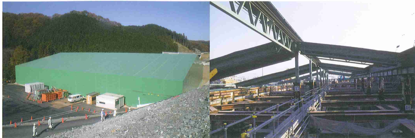
地盤改良施設用テント倉庫