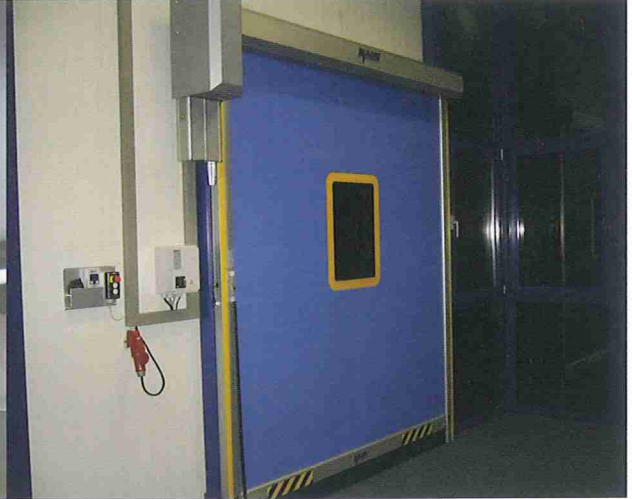
ロール式高速シャッター ALBANY ASSA ABLOY