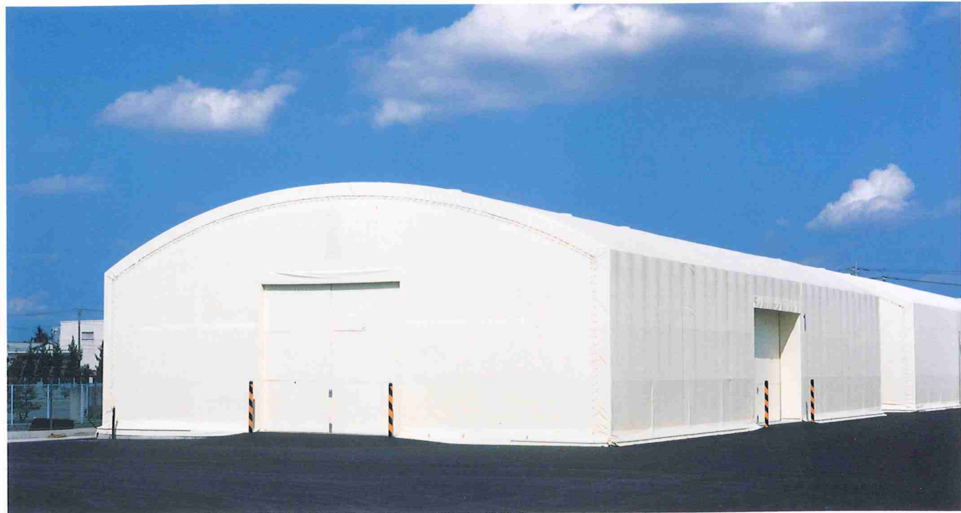
KRG100 シリーズ (固定式テント倉庫)