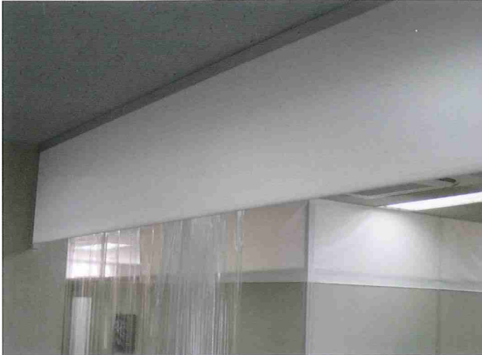
超軽量防煙垂壁(テント製)