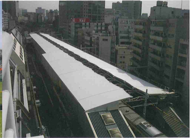
膜構造建築 JR東日本水道橋駅