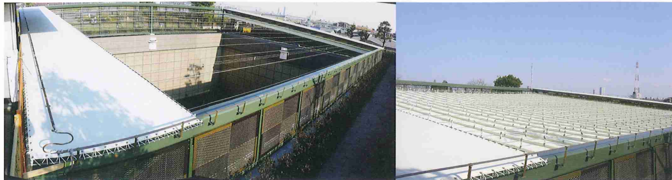
屋根開閉式テント