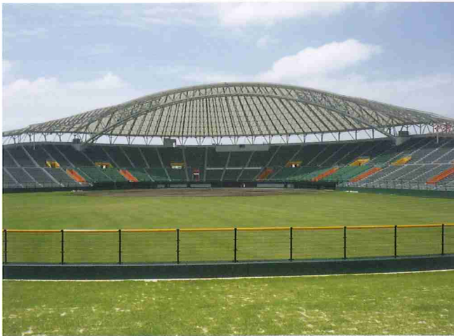
膜構造建築 那覇市宮奥武山野球場